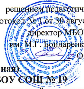
Таблица-сетка часов (недельная) учебного плана для VIII-IX классов МБОУ СОШ № 19 им. М.Г. Бондаренко с. Ольгинка, реализующих федеральный государственный образовательный стандарт основного общего образования на 2024 – 2025 учебный год

решением педагогического совета протокол № 1 от 30 августа 2024 года директор МБОУ СОШ № 19 им. М.Г. Бондаренко с. Ольгинка © В. Мальцева