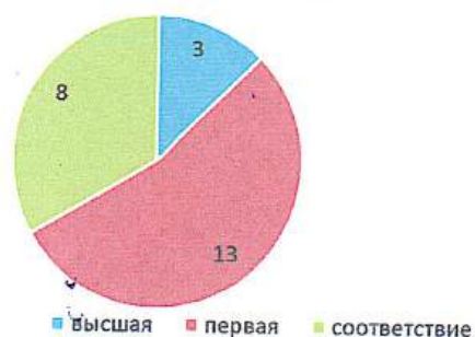
Квалификация педагогических работников